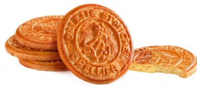
Galette Saint Michel